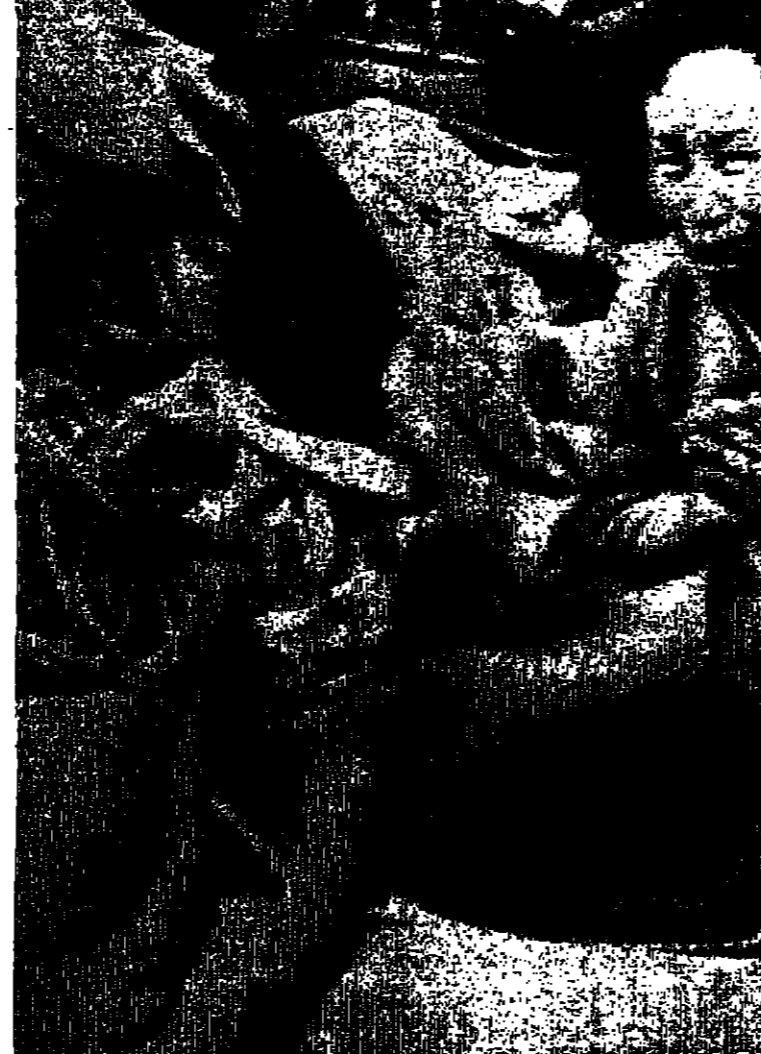
امرأة فينشامية جنوبية تصلي وهي ترفد المومع بينما جالس الطفل وقد غطي عينيه فلما انه انه بذلك يتحاشى سمع الرصاص الذي كان يملغ في الحصى من سايون

نوكيس (ولاية أريزونا) - رويتر - وجه البوليس هنا تهمة القتل غير المتعمد الى والدي فتاة فقيرة قتل نفسها على قتل كلبها كعقاب لها على نضبة الليل في الخارج مع رجل.